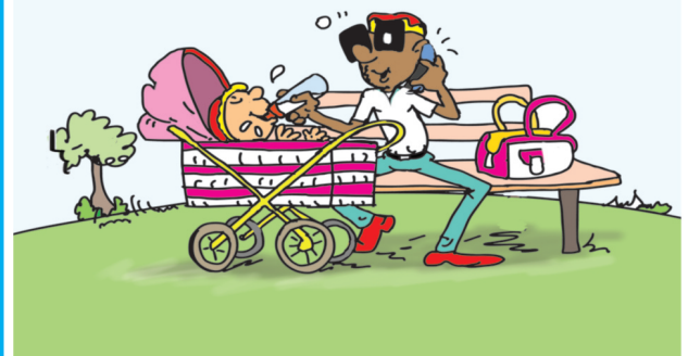
O carrinho, a pasta, o banco, a árvore, a barba, os óculos.