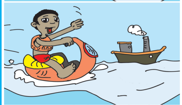
O BARCO, A ÁGUA, OS DEDOS, O BANCAL, O VOLANTE, A BOCA, O PÉ.