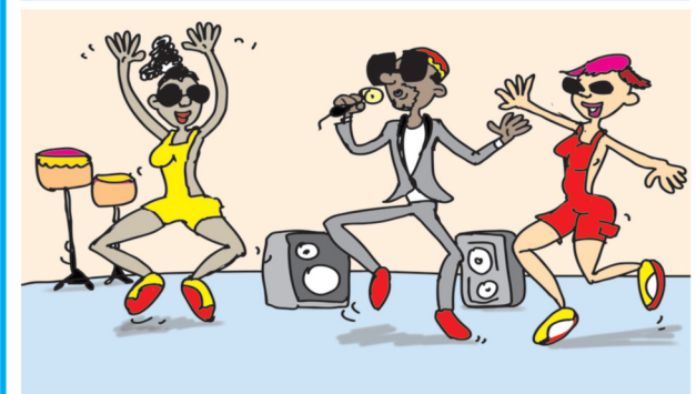
OS BASTUQUE, O FATO MACAÇÃO, A COLUNA, O MICROFONE, O FATO, OS CALÇADOS, OS ÓCULOS.