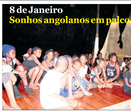
8 de Janeiro Sonhos angolanos em palco