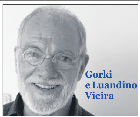
Gorki e Luandino Vieira